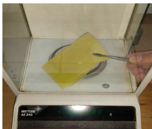
Figura 1: Pesaje de muestra plegada antes del tratamiento de exposición a intemperie.

Una vez cortadas las muestras se las limpió con solución de etanol, sumergiéndolas durante 15 min. Luego se secaron en estufa por 30 min a 70 °C y se las colocó en desecador hasta peso constante. Finalmente se midió el peso inicial de las muestras (Figura 1) que serían sometidas luego a la exposición a intemperie.