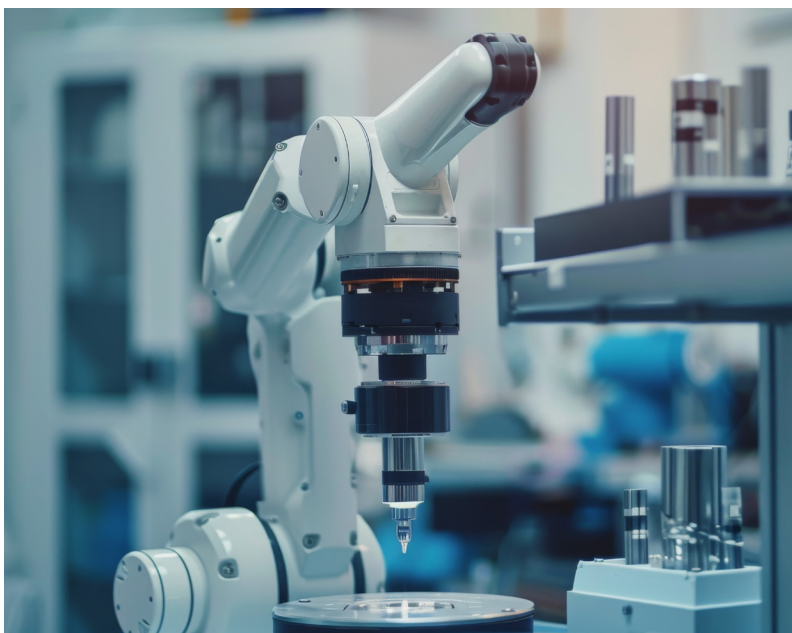
Imagen generada con IA generativa

“...La aplicación de la IA permitirá adaptar los materiales de estudio, los métodos de enseñanza y la evaluación del progreso de manera dinámica, ajustándolos a las necesidades individuales de los estudiantes y fomentando así un aprendizaje más profundo y significativo”.