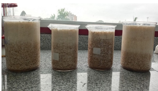
Figura 3-Procesamiento para obtención de HSM.

El otro lote se sometió a un proceso de extracción húmeda (Figura 3). Las vainas sin semillas y trozadas fueron trituradas, para esto se utilizó una licuadora industrial de alta rotación, con agua a 60°C en relación 1:6 (masa de vainas/volumen de agua), a velocidad media durante 3 minutos. Se mantuvo la mezcla triturada a 60°C en baño termostático durante 30 minutos para extraer los solubles de la