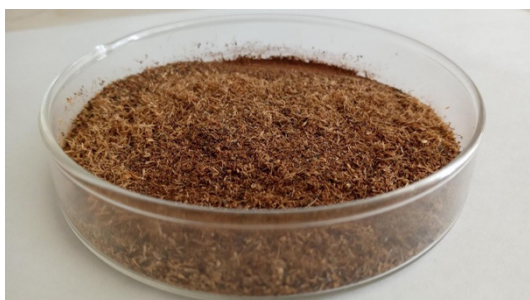
Figura-2 Harina de acacia negra (HSS).

Las vainas libres de semillas se dividieron en dos lotes. Un lote fue procesado en molino de laboratorio y así se obtuvo la harina sin semilla (HSS) (Figura 2).