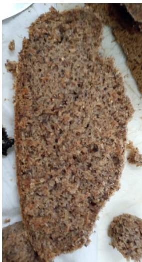
Figura 5 Muestra de pan de acacia.

Con las harinas obtenidas mediante los dos procesos antes descritos se elaboraron panes utilizando como base una premezcla comercial libre de gluten.