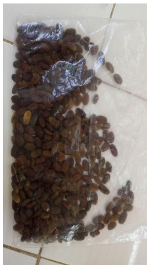
Figura 1 - Semillas separadas de las vainas de acacia negra.

Las vainas libres de semillas se dividieron en dos lotes. Un lote fue procesado en molino de laboratorio y así se obtuvo la harina sin semilla (HSS) (Figura 2).