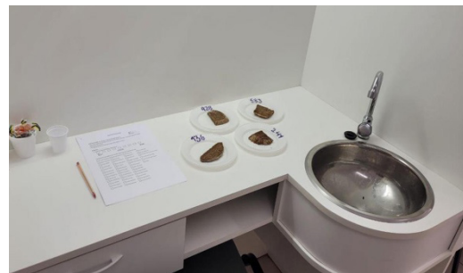
Figura 6-Laboratorio de evaluación sensorial con muestras y planillas dispuestas.

Los ensayos se realizaron en una única sesión sensorial en el laboratorio de evaluación sensorial diseñado en concordancia con la ISO 8589 (ISO 1988), equipado con luz artificial del tipo luz día, con temperatura controlada (24°C) y circulación de aire. Las muestras fueron servidas codificadas y siguiendo un orden no estructurado para no condicionar la percepción del consumidor, en porciones aproximadamente de 20 g y agua como borrador (figuras 5 y 6).