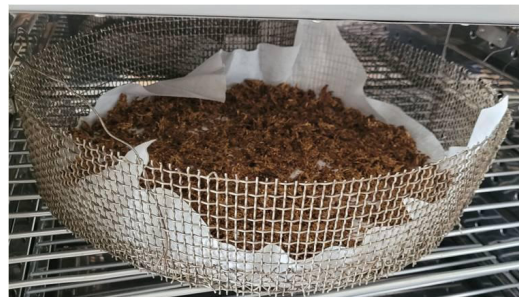
Figura 4- Torta húmeda en estufa.

pulpa. Luego se filtró con tela descartable. La torta húmeda se dispuso extendida en láminas de aproximadamente 1 cm de espesor, en canasto de acero inoxidable sobre tela porosa. Se secaron en estufa con circulación de aire forzado a 60°C (Figura 4).