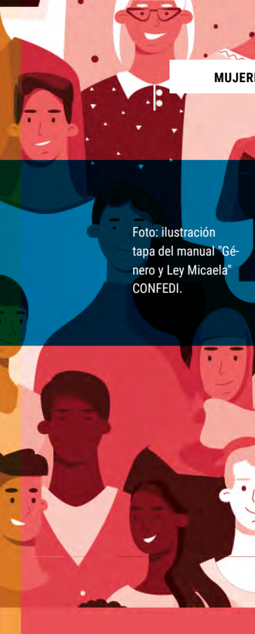
Foto: ilustración tapa del manual "Género y Ley Micaela" CONFEDI.

“ la Red generará herramientas para facilitar el diseño y desarrollo de políticas que contribuyan a erradicar las desigualdades de género y las violencias en las unidades académicas pertenecientes al CONFEDI”