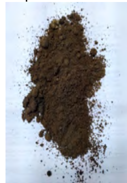
Figura 1: Arena con hidrocarburos.

En la primera etapa del trabajo se caracterizó el suelo con hidrocarburos (AH), obtenido como desecho de una industria petrolera en Mendoza (Figura 1).