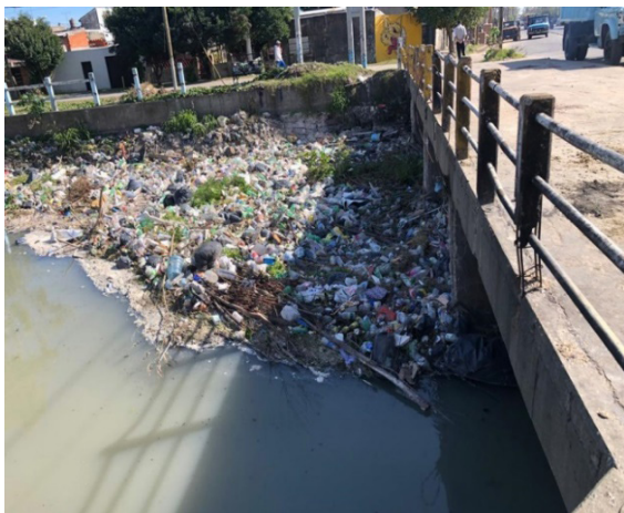
Figura 3: Punto de muestreo n°4 (PM4).

El tramo PM3-PM4 posee una mayor densidad poblacional, mataderos y frigoríficos. Visualmente hay un mayor volumen de residuos que los puntos anteriores y la mitad del arroyo se encuentra interrumpido por una barrera de basura, ramas y restos orgánicos (Fig. 3).