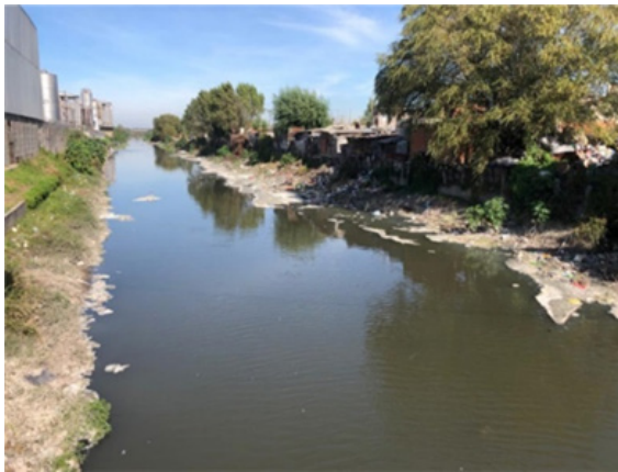
Figura 2: Punto de muestreo n°3 (PM3).

hículos y partes de ellos hundidos (estos son descartados generalmente por actividades delictivas), olor nauseabundo y presunta grasa como sobrenadante retenido por la basura y vegetación de la vera del cauce (Fig. 2). Se sospecha que la materia orgánica presente como sobrenadantes de color blanco es generada por una refinería de grasa ubicada en las cercanías de este punto, dado que la misma ha sufrido clausuras por diferentes organismos de control debido a la ausencia en el tratamiento de sus efluentes y presencia de cañerías clandestinas.