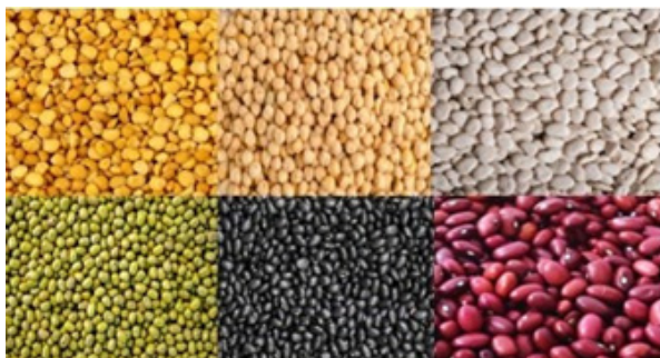
Figura 1. Granos de arvejas amarillas, garbanzos, porotos navy, mung, negro y aduki

En la Figura 1 se observan legumbres de arvejas amarillas, garbanzos, porotos navy, mung, negro y aduki, actualmente en estudio.