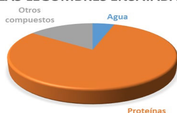
Figura 2. Composición química del promedio de los concentrados proteicos de las legumbres ensayadas

En cuanto a las propiedades tecno-funcionales se observan los datos obtenidos de tres legumbres en la Tabla 1.